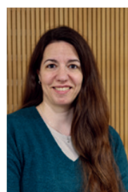
Aurore Lepecq Commission Communication