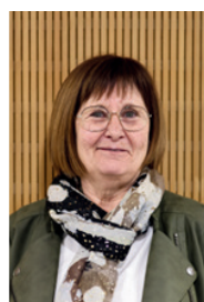
Pascale Rigault Maire