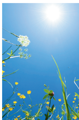
JOB D'ÉTÉ 15