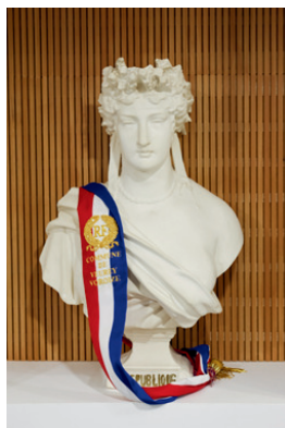
VIE MUNICIPALE 04 > 08