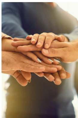
VIE ASSOCIATIVE 10 > 13