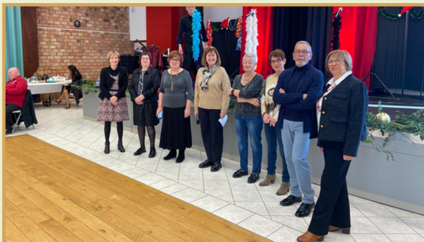
L'équipe du CCAS au complet (ou presque), au dernier rendez-vous du repas de Noël pour le mandat en cours.