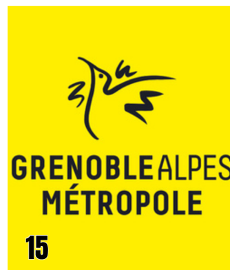
LA MÉTROPOLE VOUS INFORME