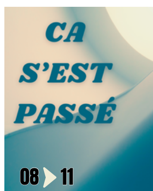
CA S'EST PASSÉ