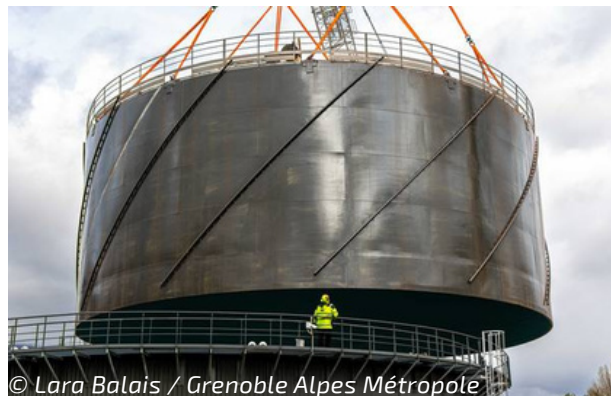
La cloche de l'un des méthaniseurs d'Aquapole, lors du nettoyage décennal. Du biogaz équivalent à la conso. de 2500 foyers est produit à partir des boues.

Le bon rendement des réseaux d'eau potable, l'utilisation des boues provenant des eaux usées pour créer du biogaz à Aquapole, la valorisation de ces mêmes boues, une fois incinérées, en cendres pour produire du ciment... Voici les exemples d'actions mises en œuvre par Grenoble Alpes Métropole, qui lui ont valu, pour la deuxième année consécutive, d'être récompensée pour son service public de l'eau et de l'assainissement.