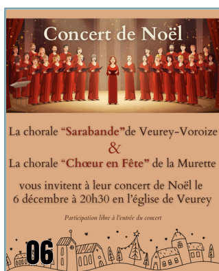
CONCERT DE NOËL