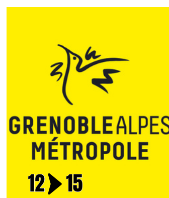
LA MÉTROPOLE VOUS INFORME