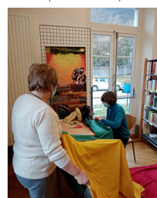
bénévoles cousant un drapeau sénégalais de 3m x 2m