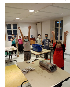
les enfants fabriquant un baobab en papier mâché