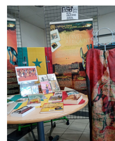
livres sur le thème de l'Afrique