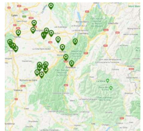
Carte : Nids confirmés de frelon asiatique sur le département de l'Isère en 2019

Les conditions climatiques de l'année semblent avoir été défavorables au prédateur. Malgré tout, le frelon asiatique continue sa progression.