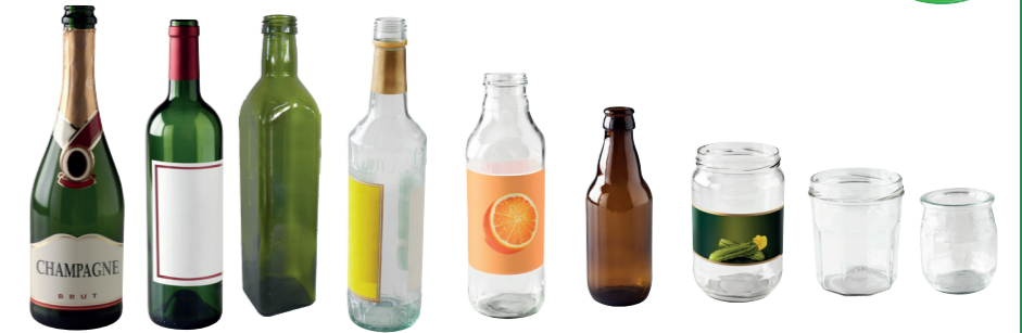
TOUS LES POTS, BOCAUX ET BOUTEILLES