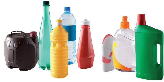
TOUS LES FLACONS ET BOUTEILLES EN PLASTIQUE