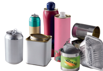
TOUS LES EMBALLAGES MÉTALLIQUES