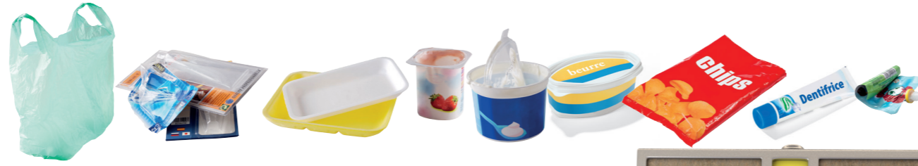
TOUS LES POTS, BARQUETTES ET FILMS EN PLASTIQUE