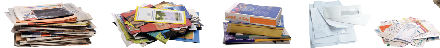
TOUS LES PAPIERS : journaux, magazines, revues, catalogues, annuaires, livres, enveloppes (avec et sans fenêtre), prospectus, publicités ...