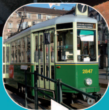
P5 - Escapade à Turin