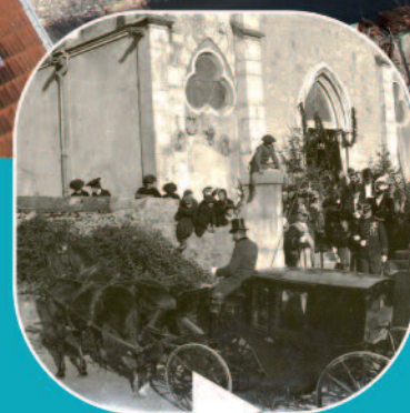
P8 - Veurey d'hier