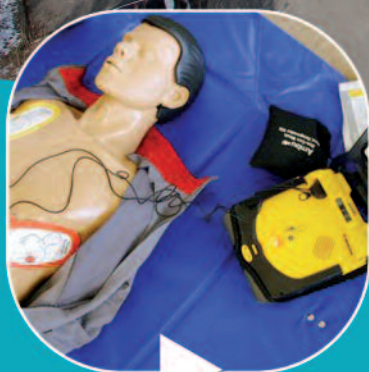
P4 - Formation défibrillateur